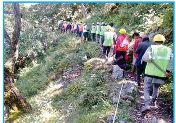
कालिकोटको पचाँलभरनामा निर्माणधीन अवस्थामा रहेको तल्लो कोल्ले सिंचाई