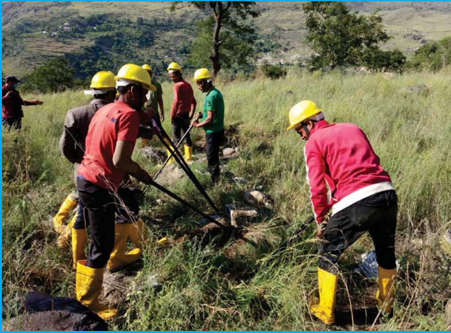
कालिकोट जिल्लाको पचालभरनामा निर्माणाधिन अवस्थामा रहेको तल्लो कोल्टे सिँचाई आयोजना