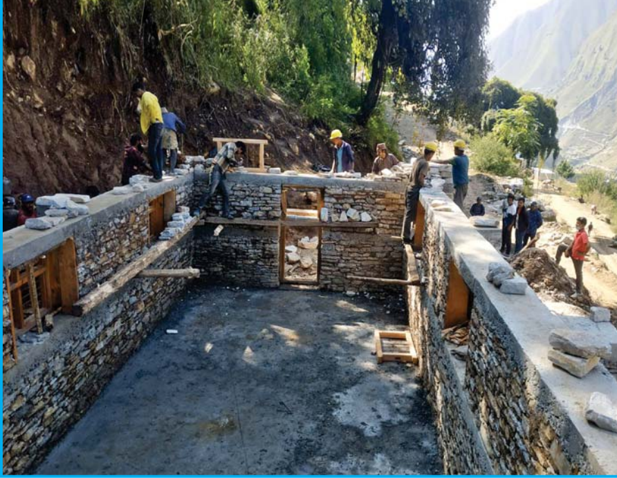
मुगुमा निर्माणाधिन अवस्थामा रहेको कृषि तथा गैर काष्ठ वन पैदावार भण्डारण केन्द्र