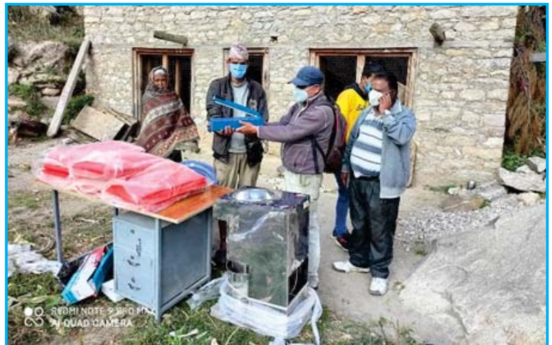
जुम्लाको हिमा गाउँपालिकामा सिस्नु प्रशोधन लघु उद्यम व्यवसाय संचालनका लागि चाहिने आवश्यक सामग्री वितरण गरिदै

समयका लागि खाद्य उपलब्धताको स्थिती सृजना गरेको छ । क्याफ्स कर्णाली परियोजनाबाट रु. ५६,९६,१६६।७३ तथा रु. ६,२२,२६७।७ बराबरको स्थानीय समुदायको जनश्रमदान जुटाइ कुल लागत रु. ६३,१८,४३४।४३ मा यो आयोजना सम्पन्न भएको थियो ।