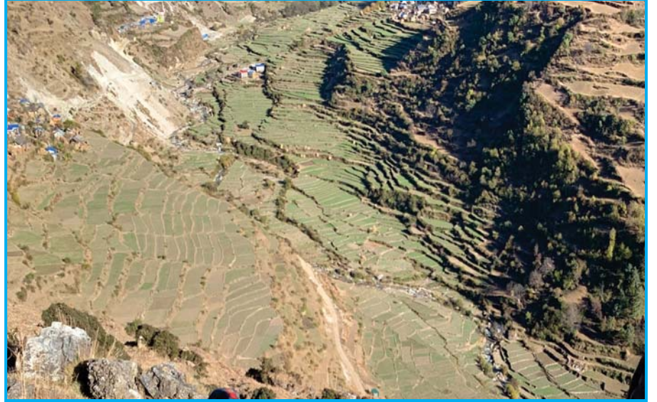
भुवानेखोलादेखि नाइदुङ्गा सिँचाई कुलो योजनाले सिँचाई हुने जमिन

यस सिँचाई कुलोको धेरै भागमा स्थाई संरचनाहरु नभएकाले मुहानबाट आउने पानीको चुहावट धेरै भई सिँचाई सुविधा प्रभावकारी हुन सकेको